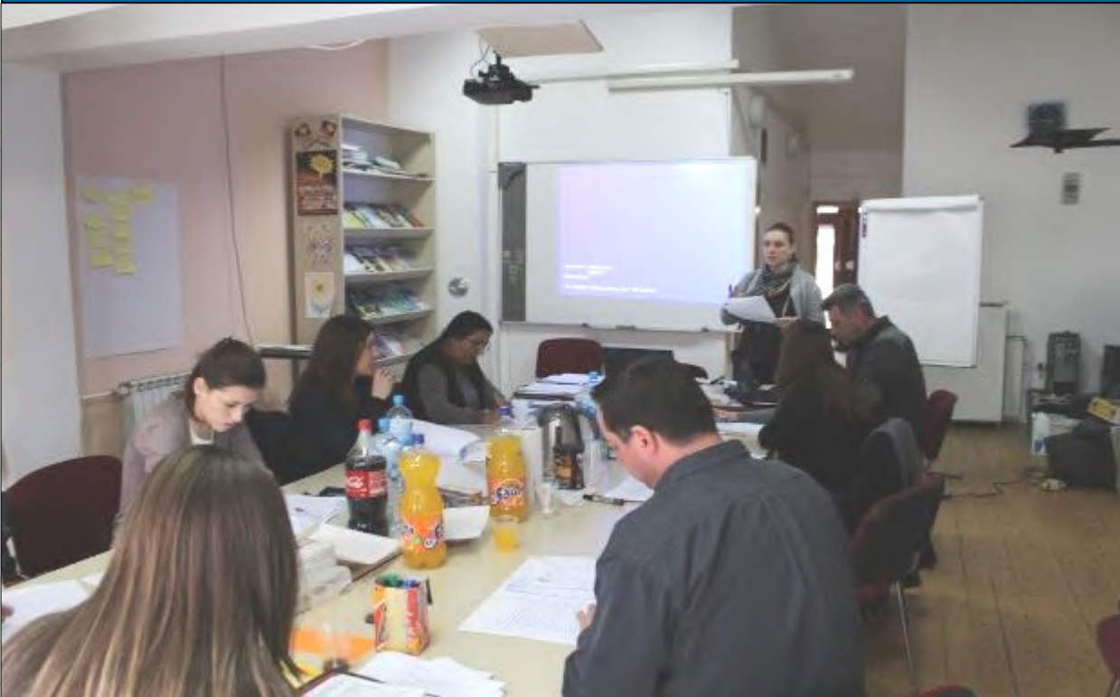
Од 29 февруари до 01.март 2012 година ,Скопје. Основи на раководење со човечки ресурси “Вие и вашиот тим,,