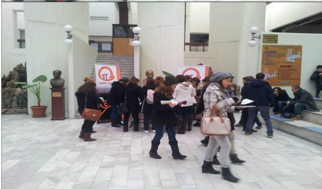
Недела за борба против ТСЛ- Делење на едукативен материјал на Филозофски факултет Волонтерите на Отворена Porta дел од овој настан

⇒ Зајакната превенција од трговија со луѓе помеѓу младите во основните и средните училишта и универзитетите преку спроведување на обуки и превентивни работилници со која што се опфатија 510 средношколци, 670 ученика на возраст од 12-15 години, и 580 студенти од универзитетите од Скопје, Битола, Штип и Тетово.