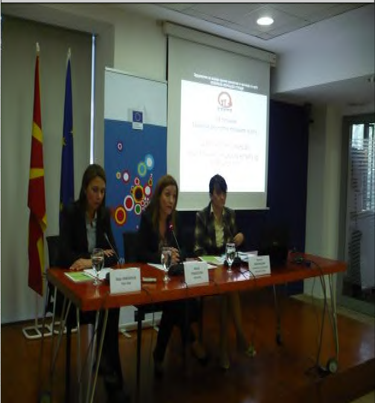
18.октомври.2012- Европски ден против трговија со луѓе

Главната цел на ова истражување беше да се согледа социо-економската положба на жртвите на трговија со луѓе и процесот на поддршка додека биле вклучени во програмата за социјална асистенција. Истражувањето се спроведе во рамките на Проектот „Зајакнување на системот на поддршка и реинтеграција на жртвите од трговија со луѓе во Република Македонија“ кој е поддржан од страна на „Кинг Баудоен Фондација“ од Белгија.