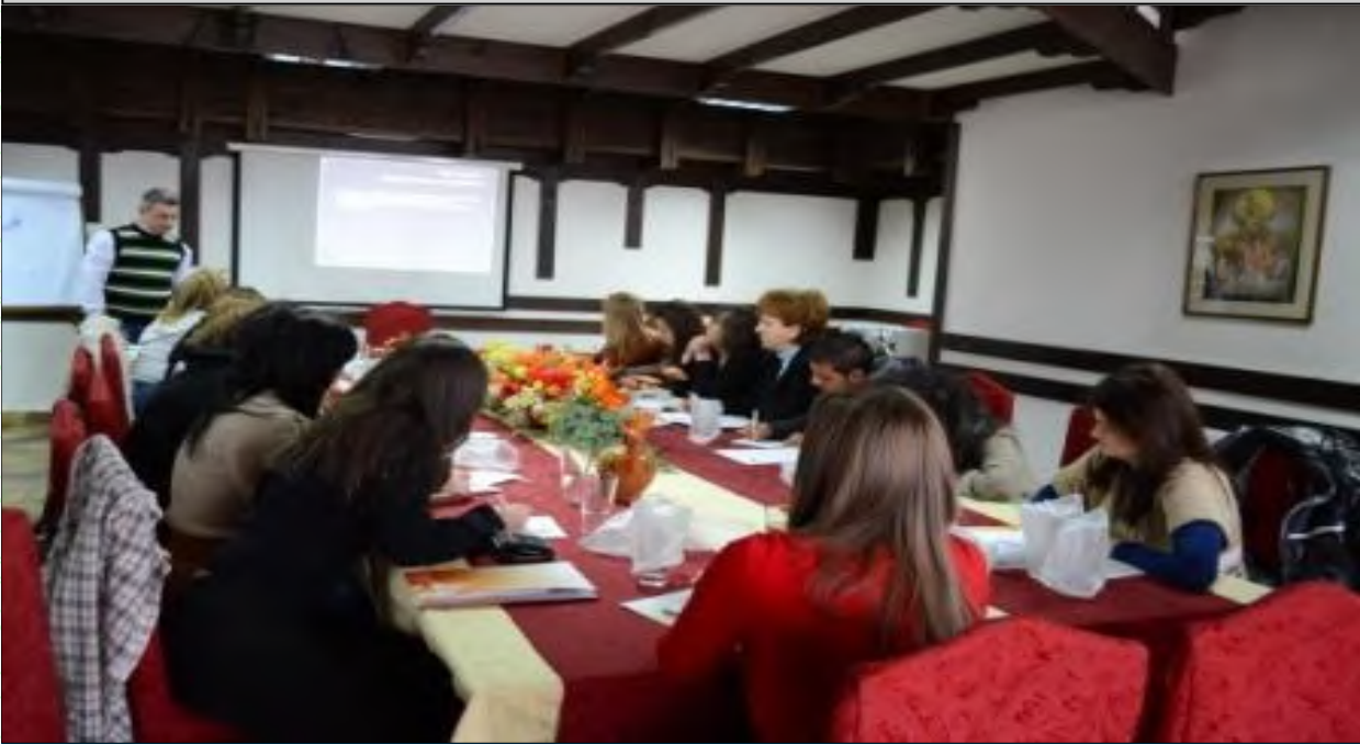
27– 29. јануари.2012 , Берово Обука за раководење со волонтери